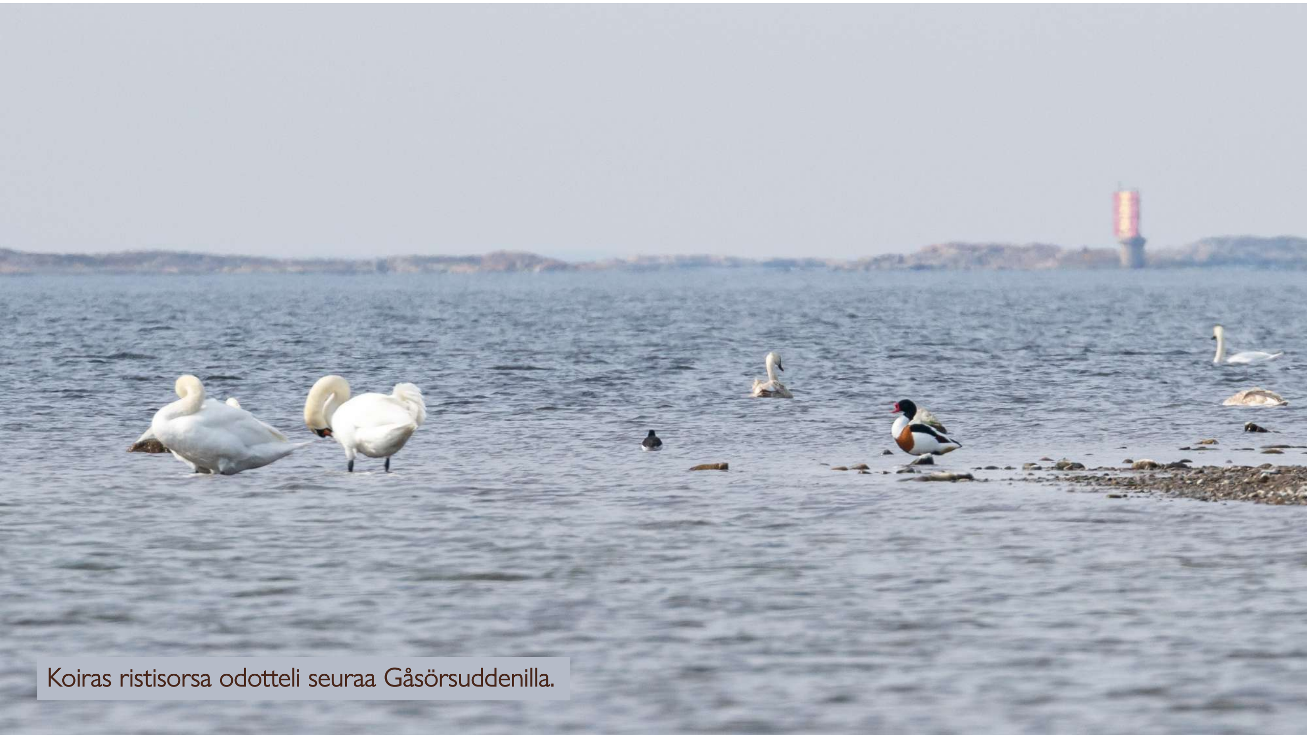
Koiras ristisorsa odotteli seuraa Gåsörsuddenilla.