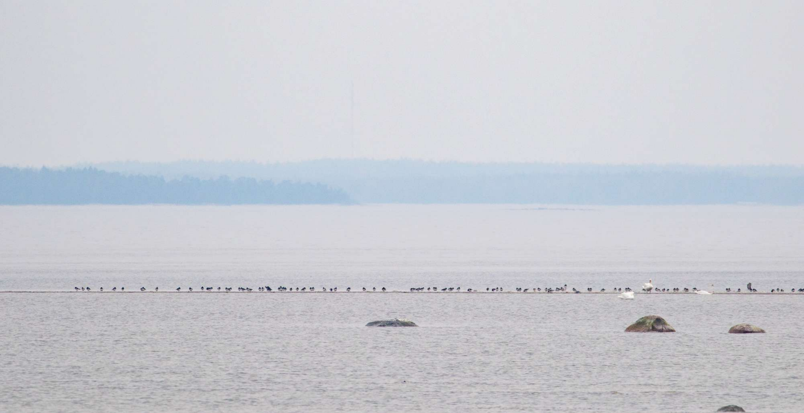
146 meriharakan parvi laskeutui muutolta Gåsörsuddenille. Särkkä on tärkeä paikka lepäileville kahlaajille sekä vesilinnuille.