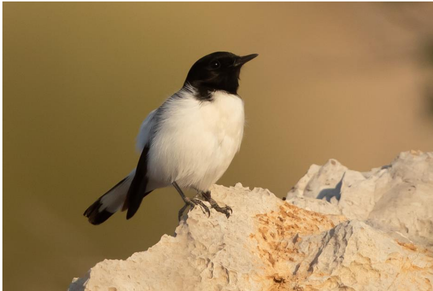
Mustavalkoinen munkkitasku on laajan taskusuvun vaikeammasta päästä määritettäviä. Iran on hyvä maa harjoitella tätä ja muita taskuja.

On pimeää ja aika lämmintä, varhain jätämme hotelli Homan (nimi tarkoittaa partakorppikotkaa) Bandar Abbasissa. Aamu jo sarastaa kun ajamme Genon suojelualan portista sisälle. Autoon nousee mukaan alueen ranger, ja eilen tapaamamme Mona on myös mukana. Vuorella sijaitsee jokin sotilaskohde, jonka ohitamme ja pysähdymme vasta 1900 metrissä. Vuoren huiput ovat 2300 metrissä, mutta ihan sinne saakka ei lupamme salli meidän kiipeävän.