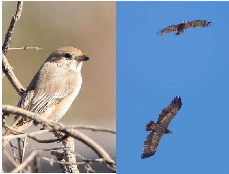
Takapihan lintuja: punapyrstölepinkäinen sekä nuori ja vanha arokoita.

peippo, tikli, sepelkyyhky, turkinkyyhky, harakka ja varis, joita kaikkia emme rannikolla tavanneet. Lisäksi nurkissa hiippailee pensastimalleita, ruostepyrstö ja punapyrstölepinkäinen. Eikä sinitaivaan alla tarvitse pitkään kulkea kun sieltä löytyy kaartelemasta arokoita ja keisarikoita, vähän pienempänä arohiirihaukka, hiirihaukka ja arovarpushaukka. Olemme laajan aavikkoalueen keskellä, jossa Shahr-e Babakin puistot ja laitakaupungin viljelykset muodostavat eräänlaisen keitaan. Olisipa mielenkiintoista olla täällä kevätmuuton aikaan. Vihreä keidas ruskean aavikon keskellä houkuttelee varmaan monenlaista muuttolintua laskeutumaan!