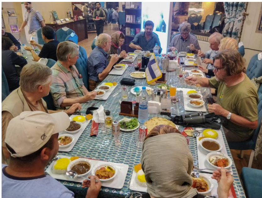
Erinomaista ruokaa lounaalla. Kotimaasta muistuttamassa lippu pöydällä. Tämä on iranilaista huomaavaisuutta.

Olemme jo pitkään ajaneet vuoristoylängöllä, joka on sekin hyvin kuivaa aavikkoa. Pysähdymme lopulta lounaalle Sirjanin kaupunkiin. Tänään on Iranissa jokin juhlapäivä ja vapaapäivä. Niinpä meidät viedään syömään kaupungin ehkä hienoimpaan ravintolaan, jonka kerrotaan olevan ”talousvyöhykkeellä”. Joka tapauksessa vyöhykkeelle ajetaan vartioidun portin läpi. Ravintolassa on paljon ihmisiä, meille on varattu oma pitkä pöytä, jossa alkuruuan (paistettua ja muhennettua munakoisoa) keskellä seisoo – Suomen lippu! Täällä meille tarjotaan erinomaisen herkullista Fesenjan-pataa, jonka valmistukseen on käytetty broileria, paahdettua hasselpähkinää ja granaattimenoista tehtyä tahnaa.