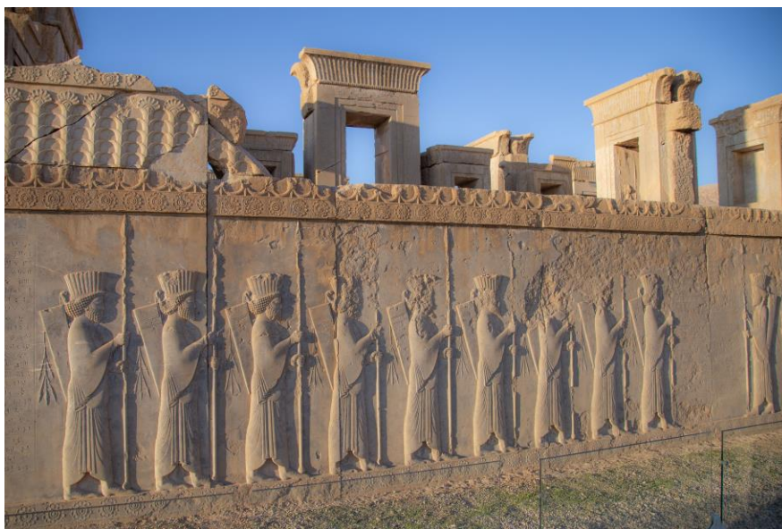
Satraappeja lahjoineen jonottamassa Persian valtakunnan kuninkaan luokse jonakin uutena vuotena noin 2500 vuotta sitten.

Noihin aikoihin järjestettiin myös kalenterit sellaiseen järjestykseen, että uusi vuosi alkaa kevätpäivän tasauksesta, joka meidän kalentereissamme on 21. maaliskuuta. Nykyinen Iranin islamilainen tasavalta pitää tästä edelleen kiinni, Nowrooz on keväällä. Ajanlasku eli vuosiluku on kehitetty myöhemmin. Kuten kaikki tietävät maailmassa yleisesti käytetään länsimaista Kristuksen syntymään kiinnittynyttä gregoriaanista kalenteria, mutta Iranissa profeetta Muhammadin Mekasta Medinaan muuttoon vuonna 621 jaa perustuvaa persialaista kalenteria. Sitä noudatetaan myös Afganistanissa.