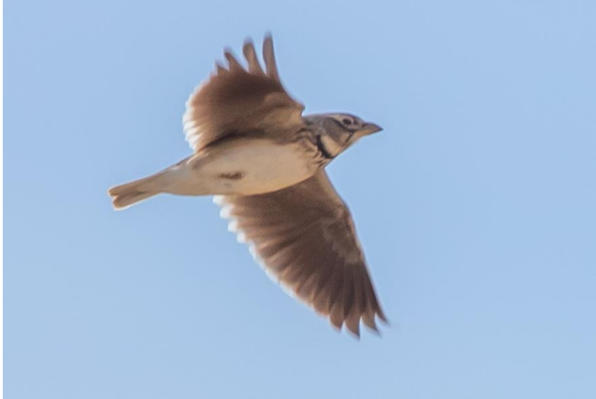
Näillä viljelyksillä talvehtii paljon kiuruja, parvissa on eniten arokiuruja.

aiemmin ollut erinomainen vesi- ja rantalintujen talvehtimispaikka. Nyt järvi on kuivunut tai kuivattu. Vesi on paennut kauas pois laakeilta kasvittomilta rannoilta. Muutama kurkiparvi erottuu siellä seisoskelemassa. Pääsemme myös maistamaan villimantelipuun hedelmiä ja ihailemaan syyriantikan tai tammitikan pistaasipähkinäpuihin tekemiä pesäkoloja. Balkanintiainen, persiantasku, muutamia hietapyitä ja parvi pensastimaleita ovat päivän mielenkiintoisia havaintoja. Ilma on nyt päivällä miellyttävän lämpöinen, mittarissa melkein 20 astetta.