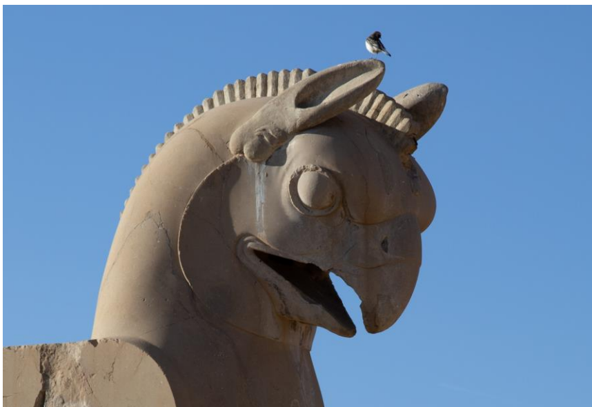
Nunnatasku istumassa uskaliaasti partakorppikotkan korvan päällä.

Mutta ei riittänyt leijonien eikä partakorppikotkien voima silloin kuin makedonialaisten kuningas Aleksanteri Suuri saapui maailmanvalloituksen matkallaan tänne. Hän voitti miesvahvuudeltaan ylivoimaiset kuningas Dareios III:n joukot Gaugamelan taistelussa vuonna 330 eaa. Sen jälkeen joukot valloittivat Susan ja Persepoliksen. Yhden kertoman mukaan joukot riehuivat