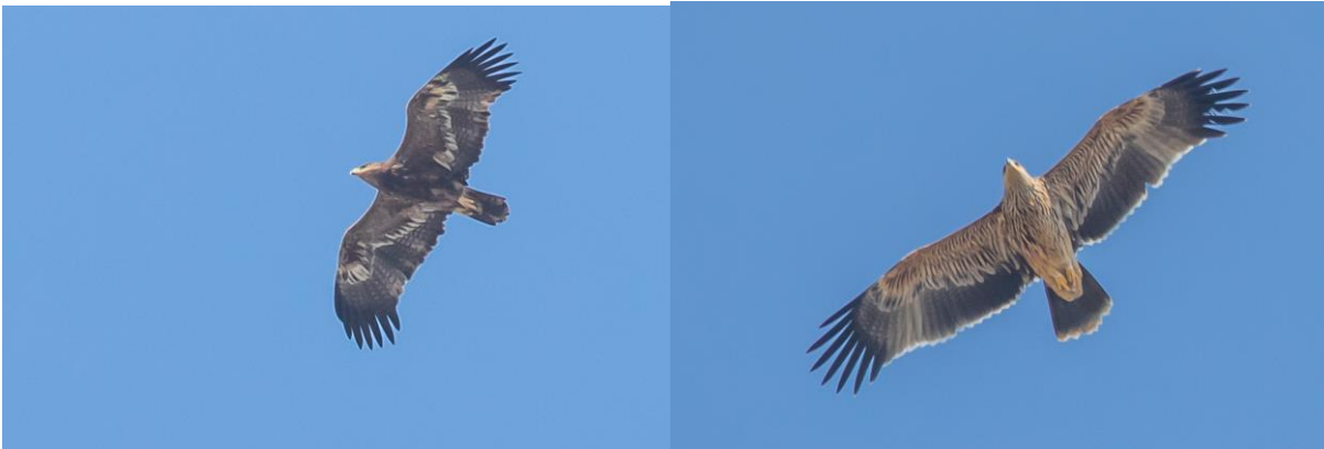
Nuoria kotkia sinitaivaalla: valkoraita arokokka ja viirurinta keisarikotka Gabrikissa.