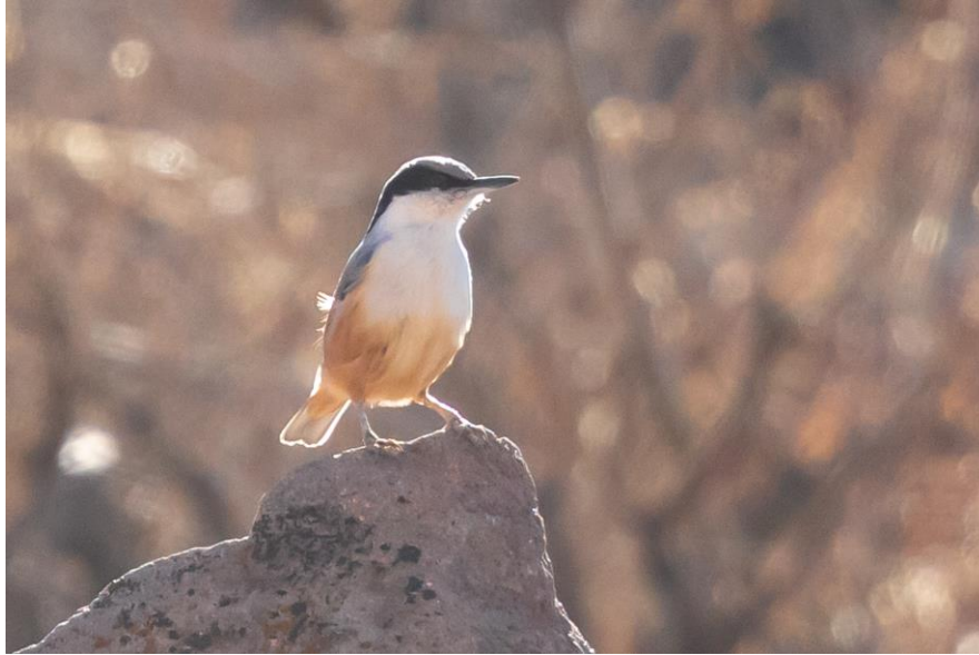
Idänkallionakkele, jonka pitkä ja paksu silmäkulmajuova on hyvä tuntomerkki. Nokan paksuus näillä vähän vaihtelee.

Aivan erilainen aamu kuin eilen. Taivas on kirkas, maanpinnalla on pakkasta ja hiljaisuus korostaa aavikon autiutta. Shahr-e Babakin itäpuolella kohoaa aavikon keskellä vuoristo. Sinne johtavalla tiellä on viitta: Abdar. Matkalla sinne tie nousee vuorten väliin ja pysähtelemme sopivissa paikoissa. Ensin on hyvin kylmää, maan pinta huurteessa. Ensimmäisenä tulevat ääneen idänkallionakkelit. Niitä täällä riittää ja lintujen kovaa ja kiihkeää mekastusta kuuluu kaikkialla, toisinaan nakkeleita säestävät valkoposkibulbulit.