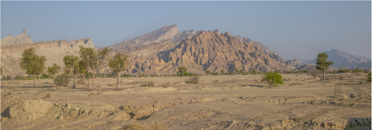
Aamiaismaisema. Aavikkoa ja liejutulivuoria taustana, lintuja niukasti, mutta löytyy kuitenkin yksi huippulaji.