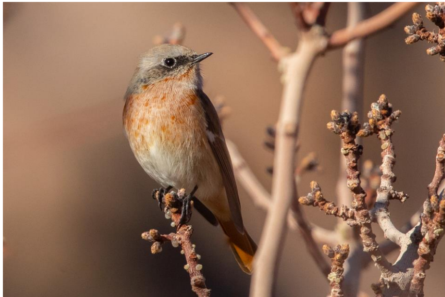
Tässä laaksossa tuntuu talvehtivan aika paljon siperianleppälintuja.

auringin valaisemaan laaksoon. Alhaalla virtaa puro, sen takana on ikivanhan puutarhan pengerryksiä. Suurin osa puista on lehdettömiä, mutta aurinko saa vielä joissakin puissa lehdet hehkumaan keltaisina.