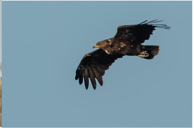
Kiljukotkan vaalea fulvescens-muoto seisomassa, tumma vanha kiljukotka lennossa samaan aikaan toisella puolella jokuomaa.