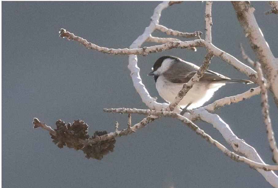
Balkanintiainen on toistaiseksi ainoa tapaamamme tiainen. Ääni on karheaa säksätystä.