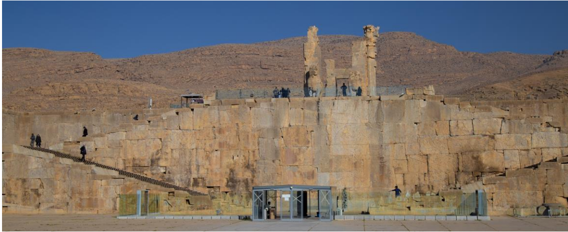
Kuuluisat portaat Persepoliksen entiseen palatsiin, ylhäällä on kansojen portti. Takana olevan vuoren rinteellä on suuruuden ajan kuninkaiden hautoja.