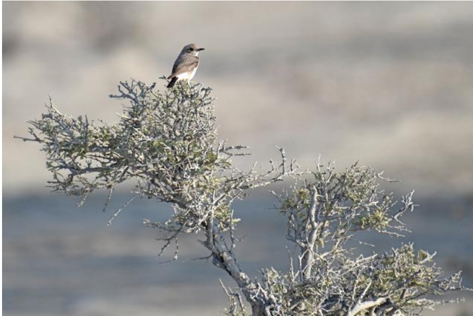
Mustapyrstö aamiaispysähdyksellä, jossa muutoin oli kovin vähän lintuja.

Siellä vuoksi on huipussaan ja vesi huuhtelee aavikon matalimpia osia, joissa kahlaa muutama jalohaikara. Kuningaskalastajan kireä ääni kuuluu pensaikosta, mutta lintua ei näy. Olemme myöhässä, mutta venekuskit ovat vielä enemmän sitä. Lopulta Hossein, tämä beluchstanilainen isäntämme saapuu poikansa kanssa ja pääsemme kahdella veneellä liikkeelle veden jo laskiessa. Kahlaajia näkyy tässä jokisuistossa niukemmin kuin edellisellä veneretkellämme toisella mangrovesuistolla. Petolintuja näkyy kuitenkin kaiken aikaa, enimmäkseen ne ovat puiden latvoissa norkoilevia kiljukotkia, kaiken ikäisiä. Kaksi talvehtivaa kalasääskeä näkyy saalistamassa tässä kalaparatiisissa. Muutamia arovarpushaukkoja näkyy mangroven päällä lennossa ja naaraspuolinen arosuohaukka ohittaa meidät.