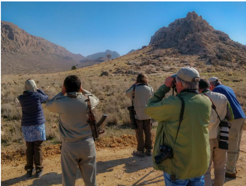
Retkellä Bamoun kansallispuistossa, puistonjohtaja on myös kiinnostunut linnuista.

Puistonjohtajalla on selässään lyhytperäinen konepistooli. Häntä ei myöskään saisi kuvata, mutta aseistettu vartija on liian kiinnostava kohde jätettäväksi ilman tallennusta. Kuva otetaan salaa. Ennen paluutamme pyydämme häntä kertomaan enemmän kansallispuistosta. Pyssykin saa selityksensä: eräs hänen työntekijöistään oli kesällä löytänyt puoliksi syödyn gasellin ja kun hän lähestyi sitä, lähellä väijynyt leopardi hyökkäsi hänen kimppuunsa. Mies ilmeisesti ampui leopardin sen jälkeen kun se oli iskenyt hampaat hänen käsivarteensa. Hän itse selvisi hengissä, mutta käsivarsi ei ole vielä parantunut.