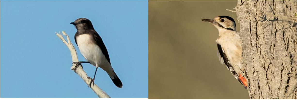
Louhikkotasku ja pakistanintikka. Jälkimmäinen on endeeminen laji näillä nurkin, muistuttaa paljon syyriantikkaa, jota täällä ei samalla alueella esiinny.

Kylän lähellä on pieni metsä, sellainen taateliapalmujen, hoikkien puiden ja piikkisten pensaiden metsikkö, jonka aluskasvillisuuden karja on tarkasti kyninyt. Opas tietää, että täällä asuu yksi pari endeemisiä pakistanintikkoja. Pienen etsimisen jälkeen linnut löytyvät. Katkenneesta puusta kurkkii kolme päällekkäistä brahmanpöllöä. Pari mustavalkoista taskua aiheuttavat taas paljon pohtimista, päädymme louhikkotaskuihin. Jo autolle käännyttyämme kohtaamme vielä intianpikkulepinkäisen pensaan latvassa. Alamme jo oppia aavikkohernekertun särisevän äänen. Tässä metsässä näitä on kymmenkunta yksilöä.