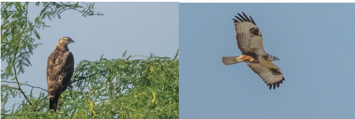
Idänmehiläishaukka, vaaleasta päästä päätellen naaras ja nuori arohiirihaukka.

Iltapäivällä suuntaamme Jaskin niemen itärannalle, jossa on paljon kalastajia veneineen ja tietysti suuria lokkiparvia. Niissä näyttää olevan täälläkin valtalajeina selkälokin tåkäläiset alalajit (barabensis ja heuglin). Joukossa on muutamia kaitanokkalokkeja. Pikkutöyhtötiirat saalistavat rantavedessä. Lokkiparvissa muutama riuttahaikara ja harmaahaikara norkoilevat jäännöspaloja lokeilta. Hiekkarannalla on niukasti kahlaajia, retkellä uutena lajina sieltä löytyy muutama pulmussirri. Sataman aallonmurtajalla nököttää etelänisolepinkäinen.