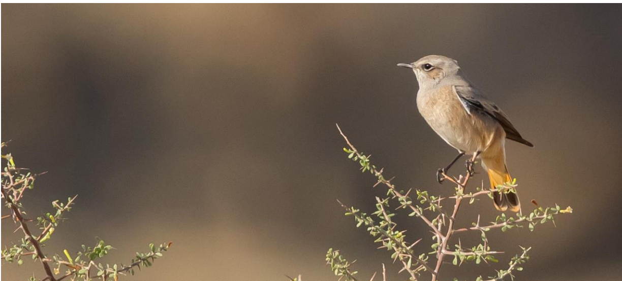
Vaaleanuskea, punapyrstöinen persiantasku on eräs Iranin endeemisistä pesimälinnuista.

Kahvi piristää ja lintujakin alkaa näkyä ja kuulua. Pikkutiltalti naksuttaa pesaikossa, sen vieressä särisee aavikkohernekerttu, johon jo eilen tutustuimme. Lähellä järveä olevalla kuivalla kummulla säksättää punapyrstöinen lintu ja seuraavalla kummulla taitaa olla pari lintua lisää. Tämä on persiantasku, jota pesii vain suppealla alueella täällä päin maailmaa. Kaksi arovarpusta nyppi jotakin vastavalon puolella. Ja nyt alkaa näkyä myös hietakyyhkyjä, lähempää näkyvät parvet ovat