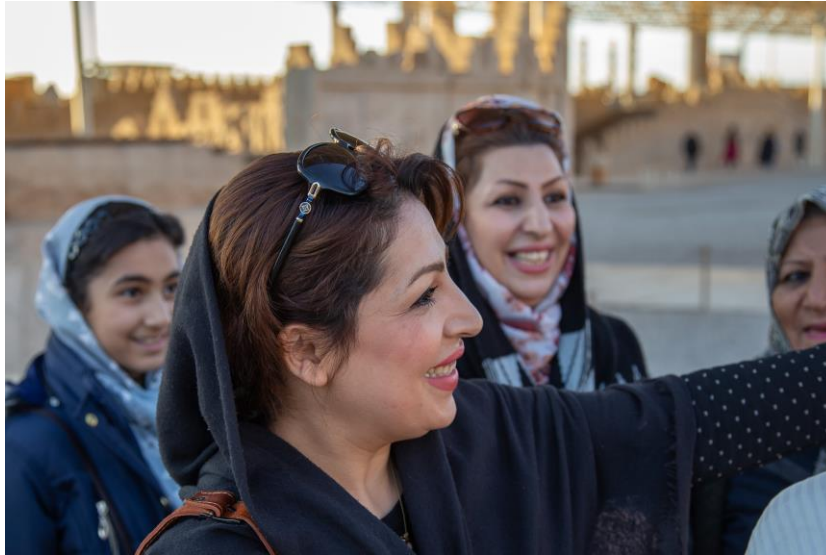
Persepoliksessa käy paljon iranilaisia matkailijoita. Edessä oleva nainen näyttää kuvaa miehestään, joka on töissä Luxemburgissa ja jonka kanssa hänellä on parhaillaan menossa Skype-puhelu.

Persepoliksessa humalapäissään ja ehkä puolivahingossa – tai tahallaan – polttivat koko kaupungin. Kaupungista on nyt jäljellä komeita raunioita pylväineen ja portaineen. Persepoliksessa järjestettiin vuonna 1971 silloisen shaahin toimesta Persian valtakunnan 2500-vuotisjuhlat. Melkein kaikki maailman valtioiden päämiehet, myös meidän presidenttimme Kekkonen juhlivat silloin täällä päiväkausia. Nykyään Persepoliksen rauniot ovat maailmaperintökohde ja Iranin ehkä kuuluisin historiallinen nähtävyys. Persepoliksen iltapäivässä ei kotkasfinksin lisäksi paljon muita lintuja havainnoida. Vuorilta kuului kaiken aikaa idänkallionakkeleiden mekastusta. Sfinksin päältä yllätämme istumasta ruskeankirjavan taskun, joka vaaleasta kalotista päätellen on nunnatasku.