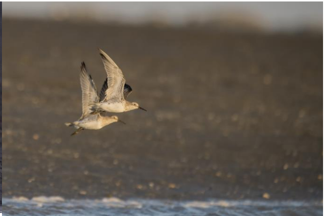
Lassen muistikortilta tehdyt kaksi jälkimäärittystä: iltahämärissä ohitettu pikkujalohaikara (täällä hyvä havainto!) ja kaksi ohilentävää vuorisirriä.