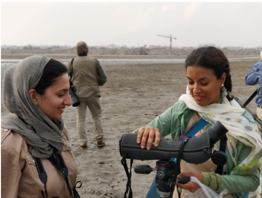
Iranilaisia lintuharrastajia Bandar Abbasin vuorovesirannalla.

Sitten seuraa yllätys. Kaksi nuorta iranilaisnaista tulee perässämme rannalle. Heillä on kunnon lintuharrastusvälineet mukanaan eikä pakollinen huivi näytä aina pysyvän hiusten suojana. Toinen