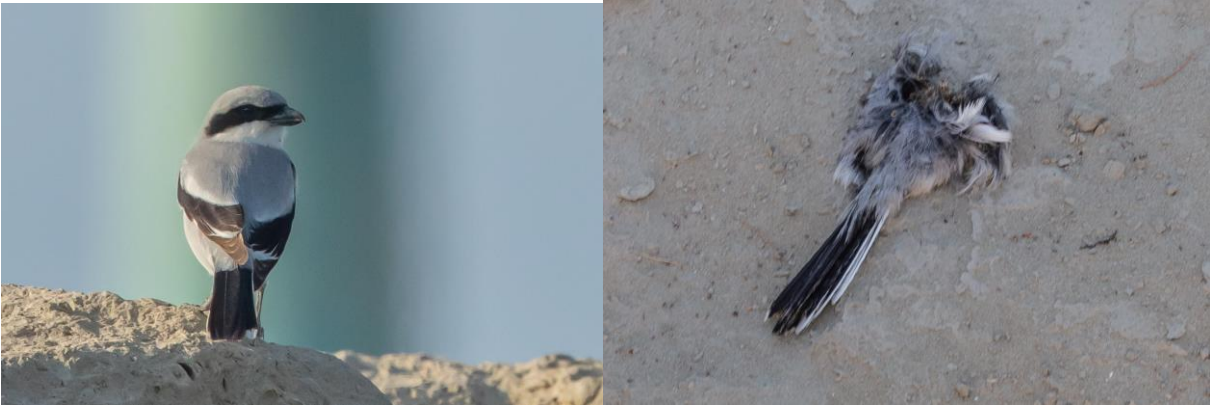
Etelänsulepinkäinen aallonmurtajalla ja toinen aavikolla syötynä. Arovarpushaukkaa epäillään.

lokkiparvia, josko sieltä osuisi silmään jotakin tavallisuudesta poikkeavaa. Nämä eriaisteiset harmaaselkäiset lokit täällä ovat vaikeita.