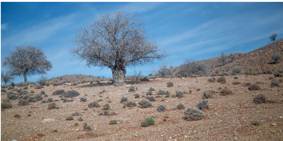
Pistaasipähkinäpuut aavikolla lienevät vanhoja, ja lehdeettöminäkin ne koristavat maisemaa.

Marvdasthin kaupunkiin on enää muutama kymmenen kilometriä kun loppuiltapäivästä pysähdymme vihreän, keinokastellun viljelyksen reunalle. Länteen painuva aurinko valaisee Zagros-vuorten takaa enää puolet pelloista. Pari kiinnostavan väristä taskua herättää paljon keskustelua, päädymme rusotaskuun ja nunnataskuun. Kiuruparvia ja kirvisiä pakenee hädissään lentoon aivan maanpinnassa saalistavan arosuohaukkakoiraan edestä. Haukka pudottautuu maahan, mutta jostakin ilmestyy toinen samanlainen jatkamaan jahtia. Tämä kaunis haukka on ottanut oppia varpushaukoilta ja käyttää saalistuksessa hyväksi ojanpohjia ja pyrkii yllättämään saaliinsa matalalta ja lujaa. Valoa on niin niukasti, että linnuista ei enää saa kunnon kuvia. Hetken päästä siniharmaa haukka taas lähestyy, mutta nyt linnussa on jotakin outoa. Siivenkärjissä on leveämmät