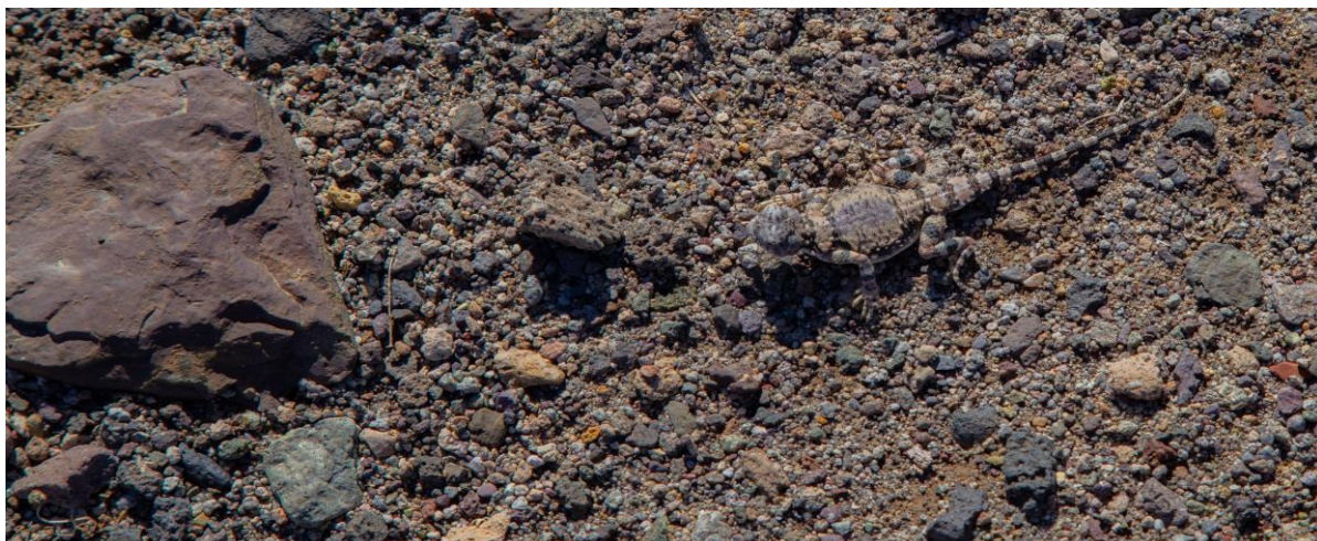
Hyvin aavikon soraan sulautuva lisko

Iltapäivällä teemme vielä toisen, lyhyemmän aavikkokävelyn, joka päättyy auringonlaskuun kello 16.50 maissa. Pikkukiurujen ja lyhytvarvaskiurujen pieniä parvia, muutama hietakyyhky ja iltakotkana arokoita.