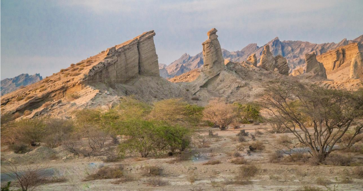
Kauniita eroosion syömiä hiekkakivivuoria, joissa näkyvät vanhat merenpohjaan syntyneet kerrostumat.

Matkalla Minabiin pysähdymme vielä kerran ennen auringon laskua. Vuoret ovat täällä mahdottoman kauniita. Sitten jo yö putoaa päälle ja jatkamme tuttuun hotelliin kaupungin keskustassa.